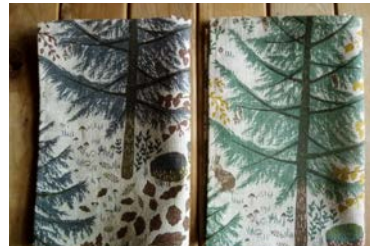
i skogen キッチンクロス