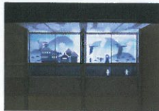
Dogo Onsenart 2014