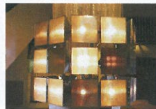
Dogo Onsenart 2014