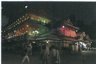
本館ライトアップ / 高橋匡太 会場：道後温泉本館