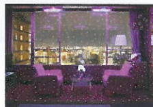
©Yayoi Kusama/Dogo Onsenart 2014 & HOTEL HORIZONTAL