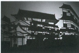
DoGo-Round / 松下裕子 会場：振鷺亭